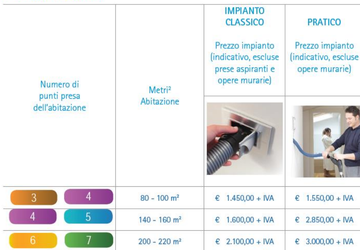
Punto presa Tubò | PRATICO