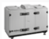
Centrali VEX 700T p. 31