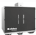
Centrali VEX 600 p. 30