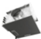
EASYVEC COMPACT p. 32